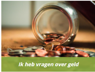
Ik heb vragen over geld