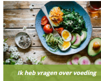
Ik heb vragen over voeding