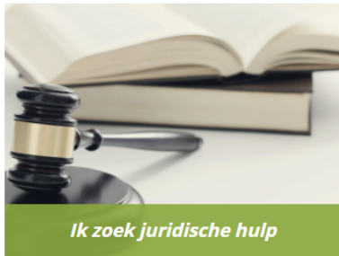
Ik zoek juridische hulp