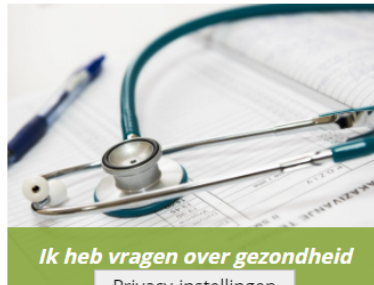
Ik heb vragen over gezondheid