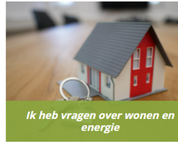
Ik heb vragen over wonen en energie