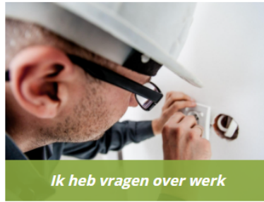
Ik heb vragen over werk